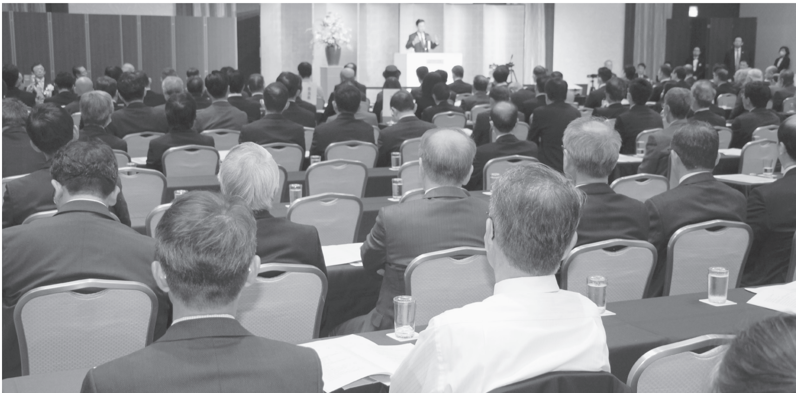
令和5年度近畿計量大会のもよう。