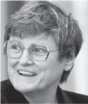
ノーベル生理学医学賞 カタリン・カリコ氏

スウェーデンのカロリンスカ研究所は10月2日、2023年のノーベル生理学・医学賞を米ベンシルベニア大学のカタリン・カリコ非常勤教授