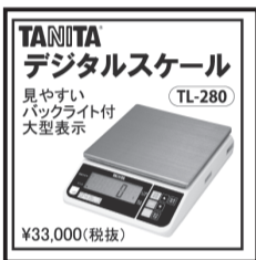
TANITA デジタルスケール TL-280 見やすいバックライト付大型表示 ¥33,000(税抜)

本総会は、5月8日付で政府発表がありまして新型コロナウイルス感染症での取り扱いが5月に引き下げられたことを受けて、本総会についても従前の開催方式での開催させていただいております。これによりまして