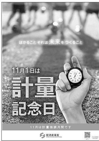
経産省作成ポスター

■2万7000枚配布 今年の計量記念日全国統一ポスターは、「あたしんち」の立花家の人々(作者は、けらえいこ氏)をキャラクターとして起用した。大きさはA2判。今年度の計量記念日全国統一ポスターは、地方計量行政機関、計量関係団体等へ2万7000枚配布した。