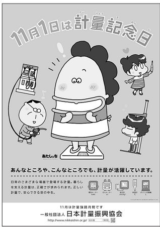
計量記念日ポスター