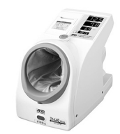
医療機関用血圧計「TM-2657」