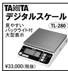
TANITA デジタルスケール「TL-280」 見やすいバックライト付 大型表示 ¥33,000(税抜)

近日常にパーソナル血圧計「UA-651BLE」やリストバンド型ウェアラブル(活動量計)「UW-302BLE」など、A&D製のBluetooth通信に