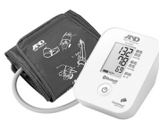
パーソナル血圧計「UA-651BLE」